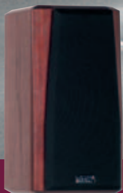
OPUS - M / 06

Neue Medien verlangen neue Lautsprecher. Der Opus - C ist wie geschaffen für alle Anwendungen, bei denen sich das Stereo- oder Heimkinoset der Wohnlandschaft unterordnen muss. Die flache Bauform und die akustische Abstimmung sind ausgelegt für den Betrieb in Wandnähe und an kritischen Aufstellpunkten. Unsichtbare Wandhalter gehören zum Lieferumfang. Als Zubehör lieferbare Stands ermöglichen die Aufstellung neben oder auf dem Bildschirm sowohl in vertikaler als auch in horizontaler Lage. Die Anforderungen an einen Lautsprecher in modernen Mehrkanalsystemen sind enorm. An alle Schallquellen werden die gleichen Bedingungen gestellt. Die beiden Tiefmitteltontonsysteme sowie der Hochtöner des Opus - C, alle mit hohen Leistungsreserven ausgestattet, müssen sowohl Dialoge als auch Musik fein nuanciert und stets verständlich reproduzieren. Die Stimmwiedergabe fasziniert mit ungeahnter Präzision und greifbarer Plastizität. Der hohe Anspruch in Punkto Materialauswahl, Verarbeitung und Klang sind Garant für wunderschöne Konzert- oder Kinoabende sowie eine makellose Ästhetik.