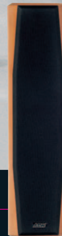
OPUS - C / 06